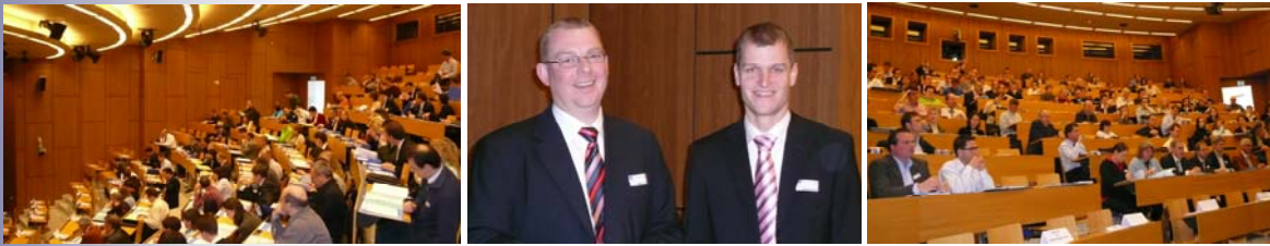
Ganztagesveranstaltung der SGfM in Zusammenarbeit mit dem Internationalen Controller Verein, AK Gesundheitswesen Schweiz, vom März 2007.