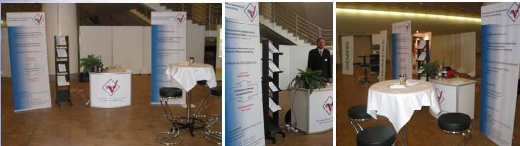
Präsenz der SGfM mit einem Ausstellerstand am Swiss-DRG-Forum vom September 2007 in Basel.